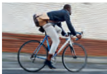
andare in bicicletta