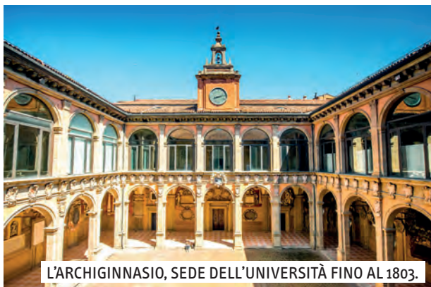
L'ARCHIGINNASIO, SEDE DELL'UNIVERSITÀ FINO AL 1803.

Nel testo ci sono 6 parole in più. Cancellate e scrivile in alto a destra, come nell'esempio.